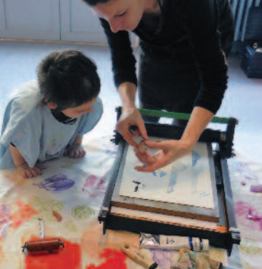
Atelier gravure par Evelyne Mary