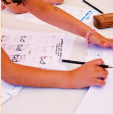
Atelier dessin par Opale BD