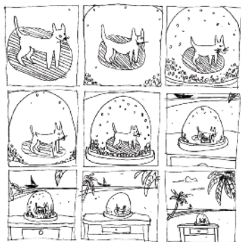
Atelier Noir Cambouis

Samedi de 16h30 à 18h Réalisez votre premier film d'animation dessiné et repartez avec sous forme de flip book personnalisé.