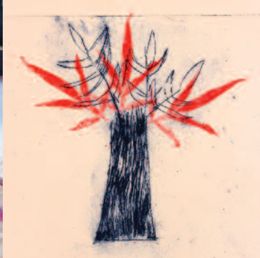
Atelier gravure par Clothilde Staës